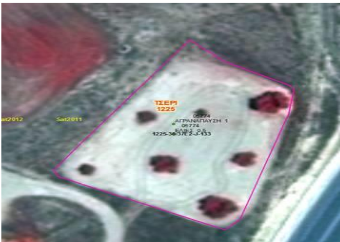
Εικόνα 1. Παράδειγμα με διάσπαρτα δέντρα που ολόκληρη η έκταση υπολογίζεται ως αρόσιμη (7 δέντρα – ΜΕΕ=1.5 Δεκάριο)

Διαφορετικά, σε περίπτωση που η πυκνότητα των δέντρων είναι ίση ή μεγαλύτερη από 10 ανά δεκάριο και τα δέντρα είναι επιλέξιμα, τότε ολόκληρη η έκταση λογίζεται ως μόνιμη δενδρώδης καλλιέργεια και θα πρέπει να δηλώνεται ως τέτοια.