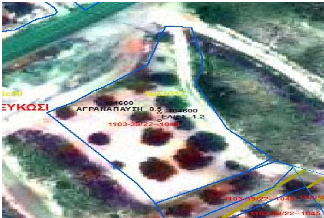
Εικόνα 2. Παράδειγμα με δέντρα που ολόκληρη η έκταση υπολογίζεται ως μόνιμη καλλιέργεια (17 δέντρα – ΜΕΕ =1.6 Δεκάρια)

Σε περίπτωση που μια έκταση θεωρηθεί σύμφωνα με τα πιο πάνω σαν « αρόσιμη γη με διάσπαρτα επιλέξιμα δέντρα » τότε θα πρέπει να δηλώνεται σύμφωνα με τον πιο πάνω διαχωρισμό, δηλώνοντας την καλλιέργεια και τον αριθμό διάσπαρτων δέντρων που υπάρχει στο αγροτεμάχιο ανάλογα με τη δήλωση.