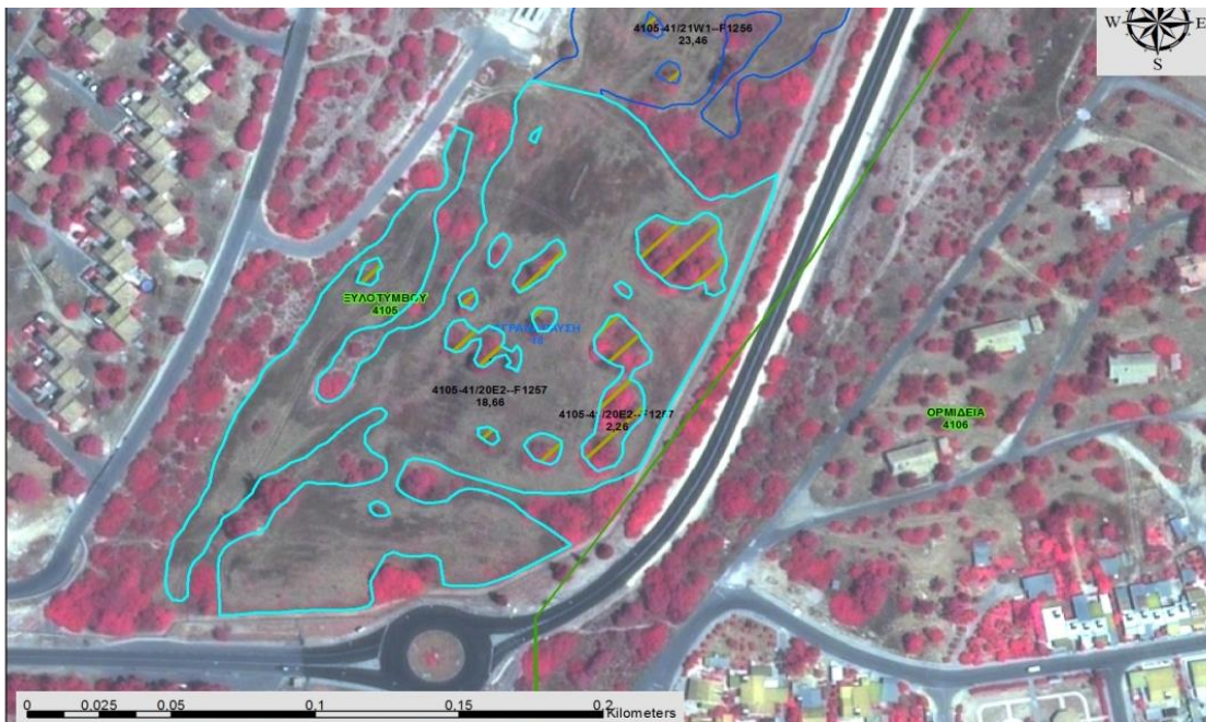
Εικόνα 3. Παράδειγμα με κομμάτι του τεμαχίου (ξεχωρίζει η αροτραία καλλιέργεια από τα δέντρα)

Στην περίπτωση που ομάδα δέντρων σε ένα τεμάχιο αναφοράς παρεμποδίζει τη γεωργική δραστηριότητα ή ισούται με ή υπερβαίνει τα 10 δέντρα / δεκάριο, τότε η έκταση που καλύπτουν τα δέντρα αφαιρείται από την επιλέξιμη έκταση της αρόσιμης γης ή του βοσκότοπου και δημιουργείται νέο αγροτεμάχιο με τη « συμπαγή φυτεία δέντρων ». Σε τέτοια περίπτωση δηλώνεται το εν λόγω αγροτεμάχιο με τη δενδρώδη καλλιέργεια πχ. ελιές και δηλώνεται και ο αριθμός των δέντρων.